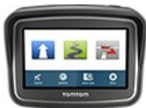
TomTom Rider v5